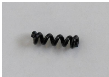
[アームテンションスプリング]

アーム取り付け穴内には、スプリングをホールドするための段付き穴がありますので、アームをはずしている状態でもスプリングが抜けにくくなっています。ただしスプリングの個体差によって、抜けてしまう場合もありますのでご注意ください。